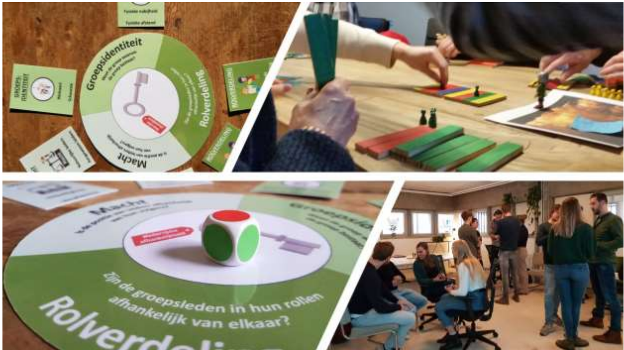
Figuur: Aan de slag met het 3 lagen cultuurmodel.

Blijf van de onderstroom en het gedrag van teams af, maar help mensen om samen een omgeving te ontwerpen die gewenst gedrag binnen hun team en binnen hun organisatie vanzelfsprekend maakt.